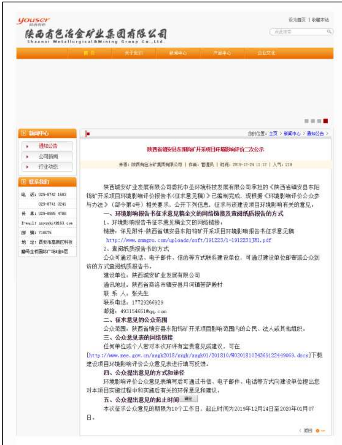
图 2 环境影响评价信息二次公示（网站）