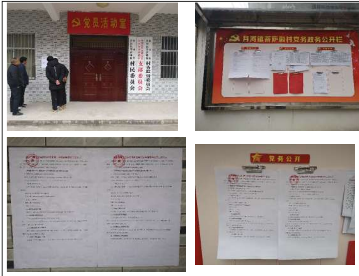
图4 环境影响评价信息二次公示（张贴）